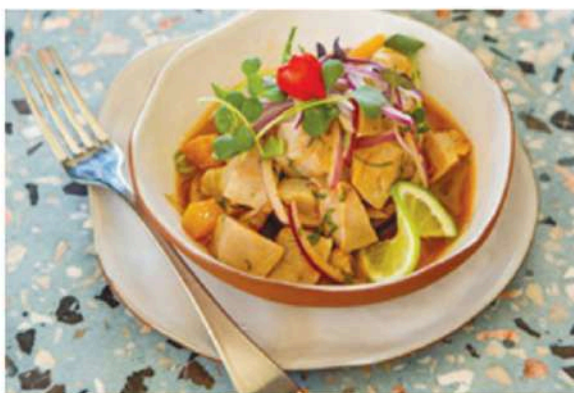
Amarillo spicy ceviche