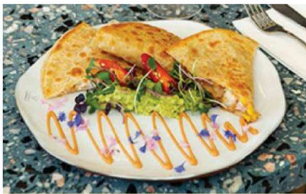
Shrimp quesadilla with guacamole