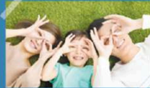
Warming their heart