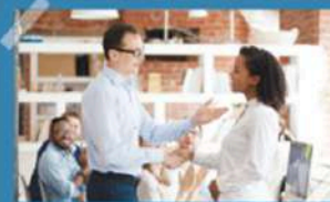
Serving as an expression of appreciation

Adapted from www.yousaidit.co.uk / www.digitalunite.com/