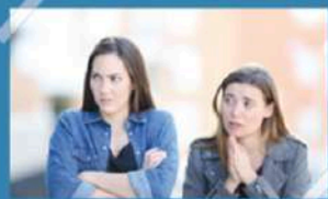
Helping you apologize sincerely