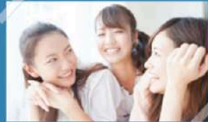
Making them laugh