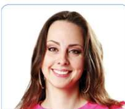
dark brown hair