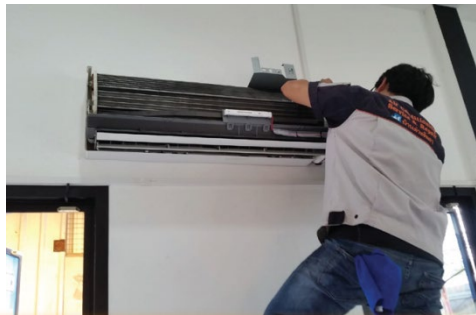
air conditioner technician