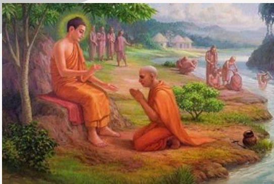
พระอัสสชิ