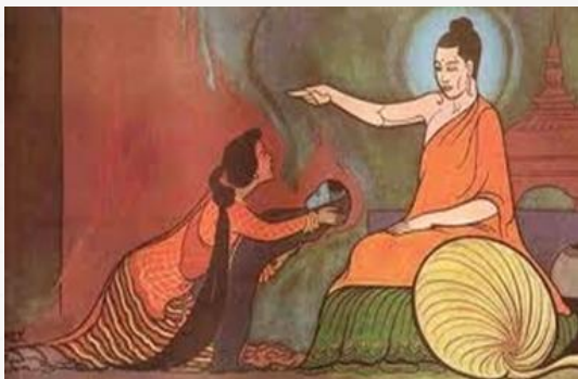
พระกัศปโคตมีเถรี