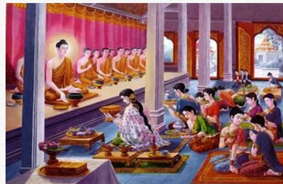
พระนางมัลลิกา