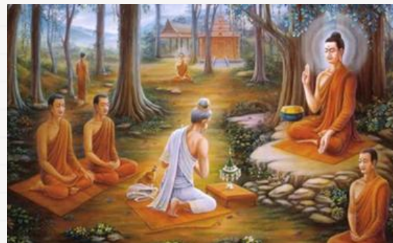
หมอชีวกโกมารภัจจ์