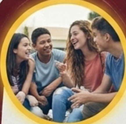
กลุ่มเพื่อน (Peer Groups)