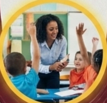
สถานศึกษา (Educational Institutions)