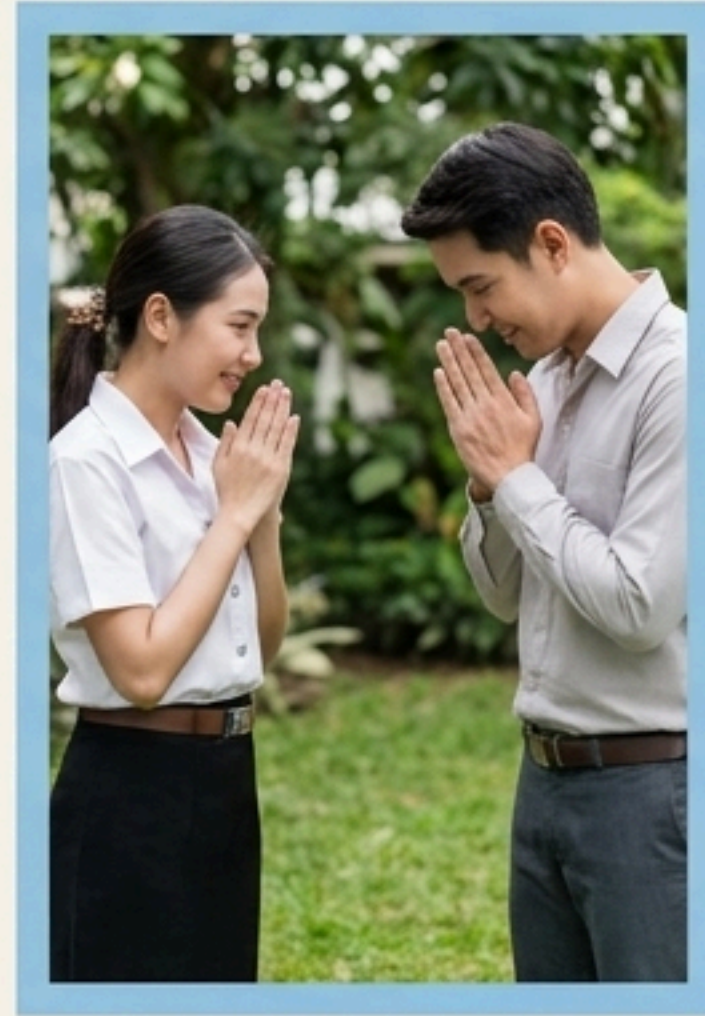
3. การสอนบทบาททาง สังคมและทัศนคติ (Roles & Attitudes)