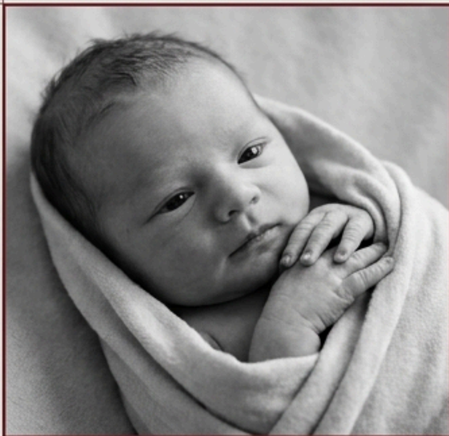
สภาพสัญชาตญาณเดิม (Original Instinct) / สภาพสัตว์ตามธรรมชาติ

ผ่านกระบวนการเรียนรู้ (Lifelong Learning Process)