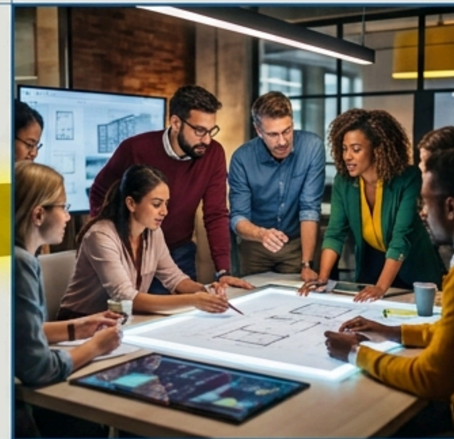
กลายเป็นมนุษย์สังคมที่มีวัฒนธรรม (Cultured Social Human)