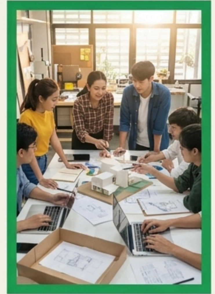
4. การสอนความ ชำนาญและทักษะ (Skills & Expertise)