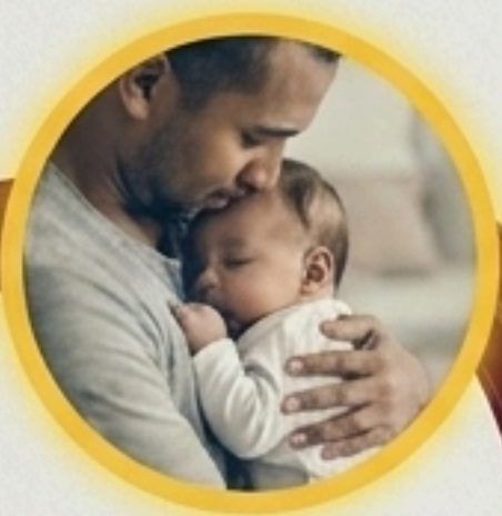
ครอบครัว (Family)