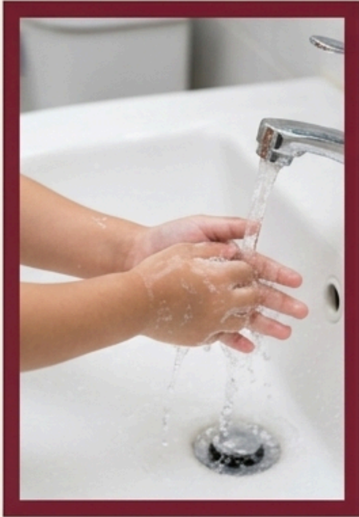
1. การปลูกฝังระเบียบ วินัยพื้นฐาน (Basic Discipline)