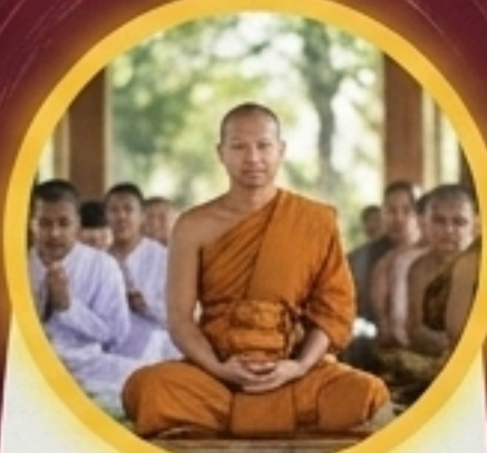
ทางศาสนา (Religious Institutions)