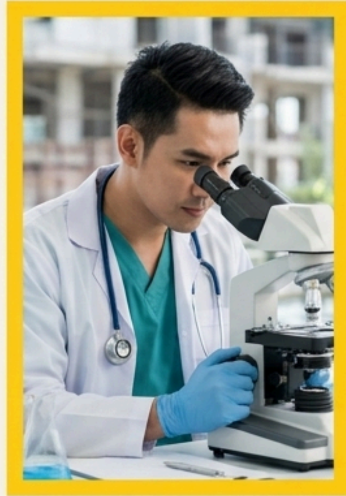
2. การปลูกฝังความ มุ่งหวังในชีวิต (Social Aspirations)